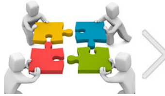
Atitude de Marca: perspectivas para 2013