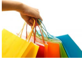
Shopper exigente força adaptação das marcas