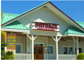
Outback cresce fora do eixo Rio-São Paulo