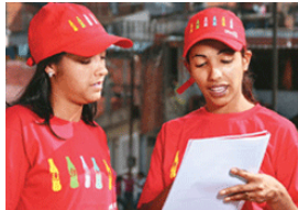
Copa acelera projetos sustentáveis da Coca-Cola