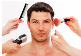
Homem no alvo da indústria de beleza