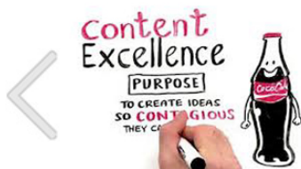
O presente e o futuro do Brand Content